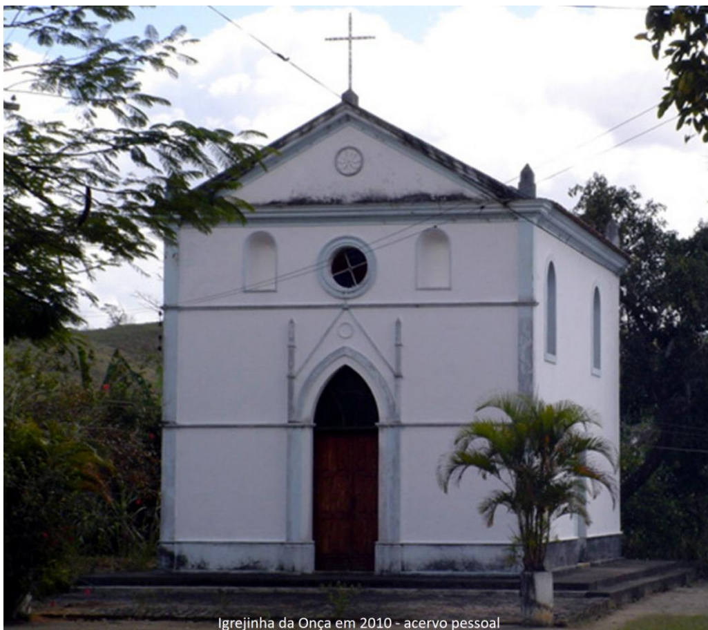
Igrejinha da Onça em 2010