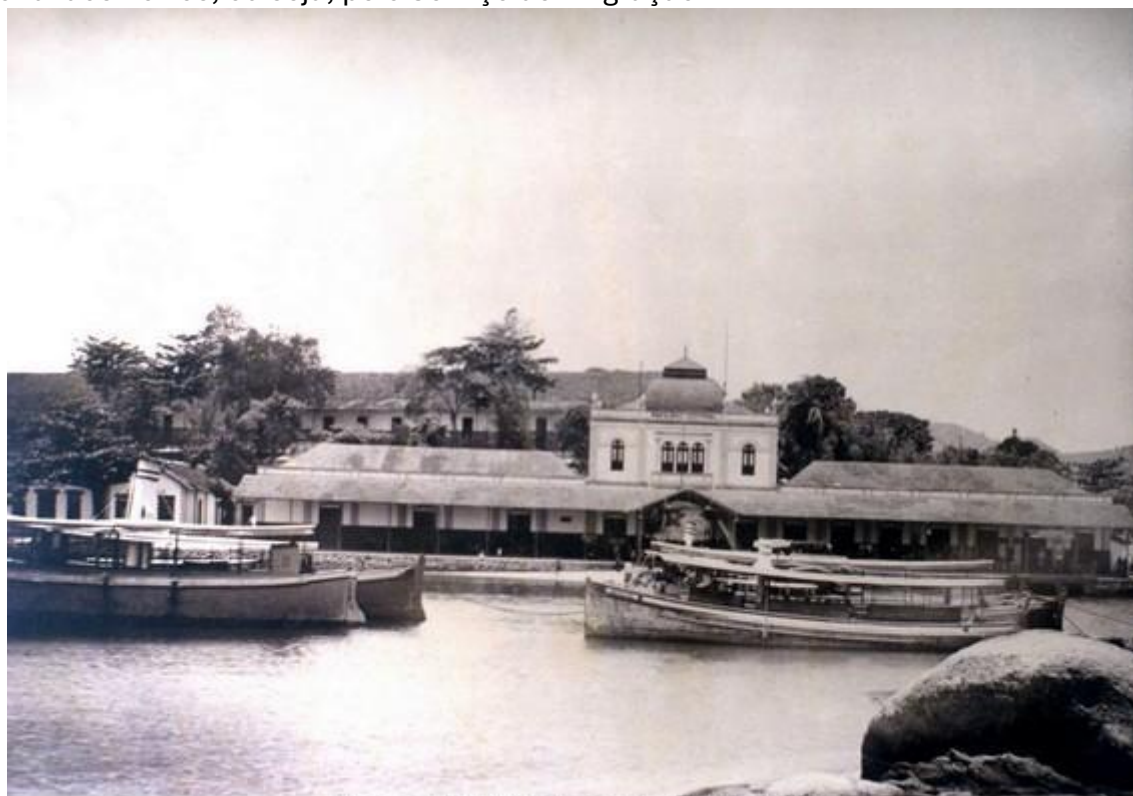
Ancoradouro e prédio da Hospedaria da Ilha das Flores

Ilha das Flores, é bom que se diga, era uma hospedaria sob a responsabilidade da União. Mas logo no seu início, o Governo sentiu necessidade de cobrar das províncias a manutenção de suas próprias hospedarias, de modo a que os imigrantes fossem encaminhados por linha férrea diretamente para elas, tão logo liberados pela Agência Nacional dos Portos, ou seja, pelo Serviço de Imigração.