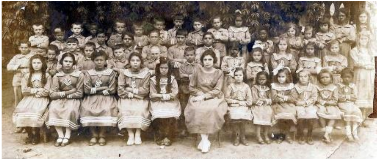
Alunos da Escola da Colônia Agrícola da Constança em 1923

Muitos descendentes dos imigrantes frequentaram uma instituição muito cara aos leopoldinenses: a Escola. Vale lembrar que, no início dos estudos sobre os imigrantes, foi surpreendente encontrar indicadores de que muitos deles preocupavam-se em não deixar seus filhos sem escolarização. E foi a partir daí que se buscou, então, conhecer o panorama da época quanto à educação formal para entender melhor essa.