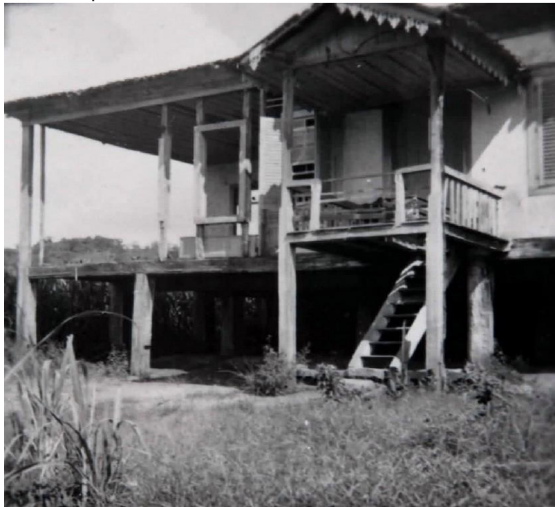
Escola da Colônia Agrícola da Constança -cerca 1912

Em Minas Gerais, até 1906, quatro anos antes da criação da Colônia Agrícola da Constança, persistia o sistema vigente no Império 14 , em que o ensino era baseado nas chamadas salas de “aulas públicas” que ficavam a cargo de um único profissional cujo ofício era ensinar “as primeiras letras” e “as quatro contas” a alunos dos diversos níveis. Salas que eram ditas públicas, mas que muitas vezes cobravam mensalidade dos alunos.