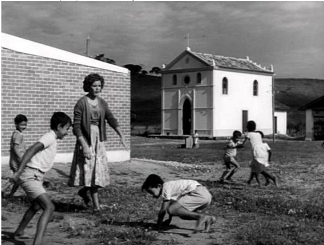
Escola da Colônia Agrícola da Constança - década de 1950

Dentro da Colônia Agrícola da Constança funcionavam, em 1918, duas salas de aulas de primeiras letras. Uma na sede da Colônia, na Boa Sorte, e outra junto à sede da antiga Fazenda Constança. Na fazenda Paraíso, vizinha da Constança, a escola começou a funcionar antes de 1920 e, na época, alguns empregados vinham procurando emprego em outros lugares exatamente porque “os filhos precisavam estudar” .